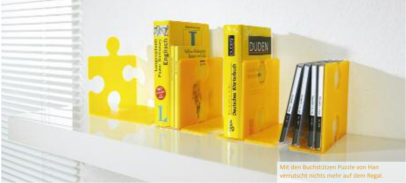
Mit den Buchstützen Puzzle von Han verrutscht nichts mehr auf dem Regal.