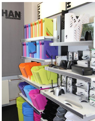
Bunt oder schwarz-weiß: Das Unternehmen hat mehr als 700 Farben im Sortiment.

Das Kerngeschäft des Herforder Unternehmens mit rund 15 Millionen Euro Jahresumsatz liegt in Deutschland. „Wir exportieren stark ins europäische Ausland“, sagt Magdanz. Rund 40 Prozent der produzierten Ware werde im Ausland verkauft.