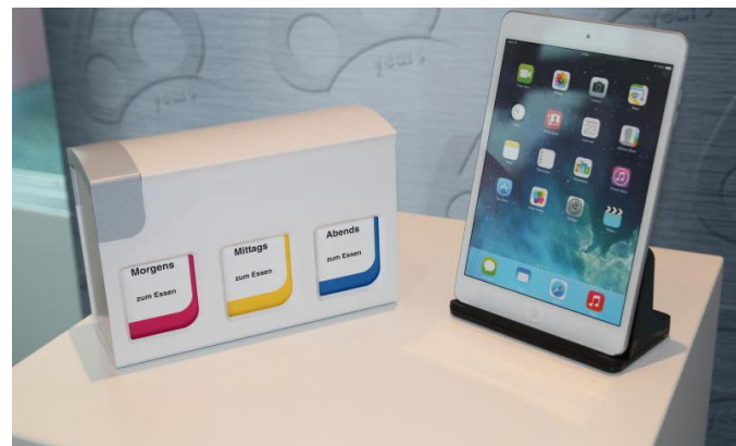
Neue Produkte: Han-Bürogeräte stellt nicht nur Artikel her, die für Ordnung im Papierstapel sorgen. Als Alltagshilfen sollen auch ein Medikamentensortierer (l.) und ein Tablet-Halter (r.) dienen.